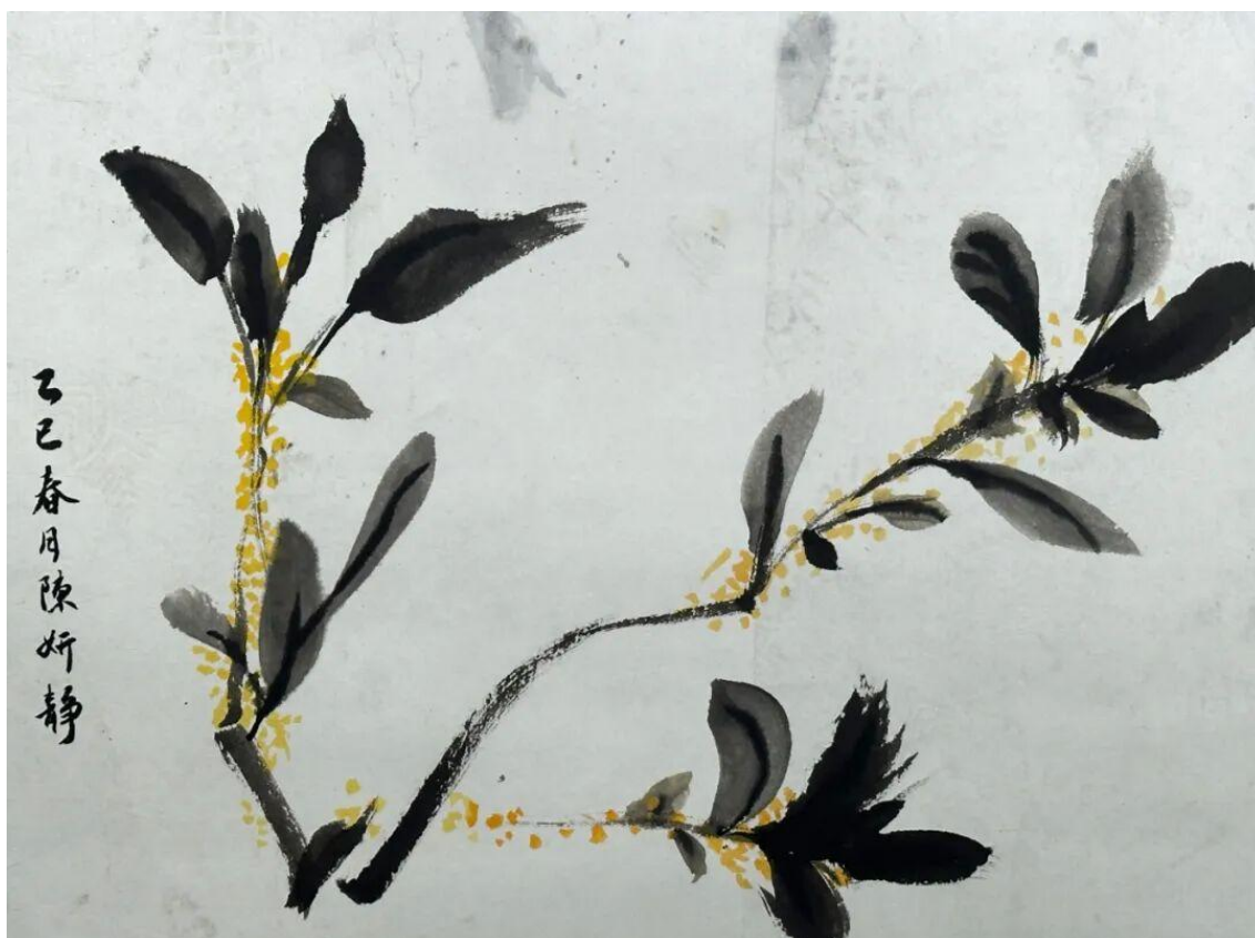
2024 级美术学 2 班陈妍静 临摹