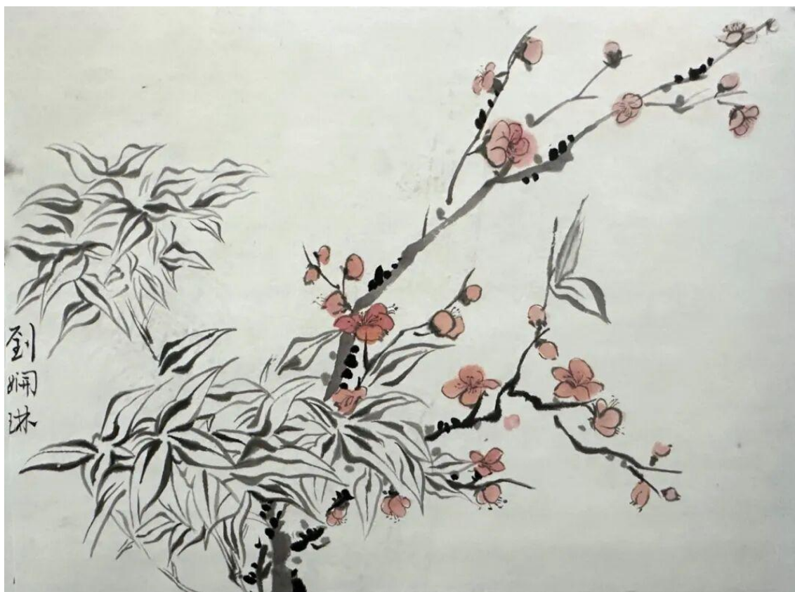
2024 级美术学 2 班刘妍琳 临摹