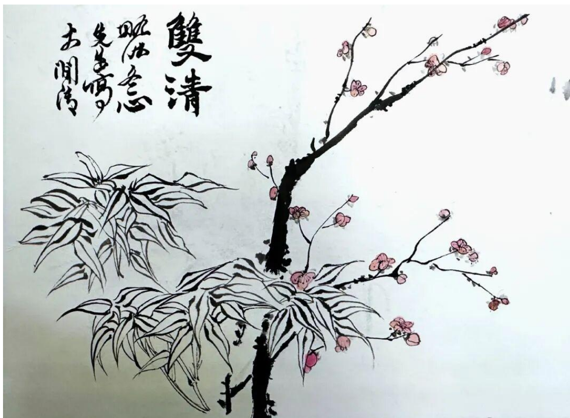
2024 级美术学 2 班赵姝霖 临摹