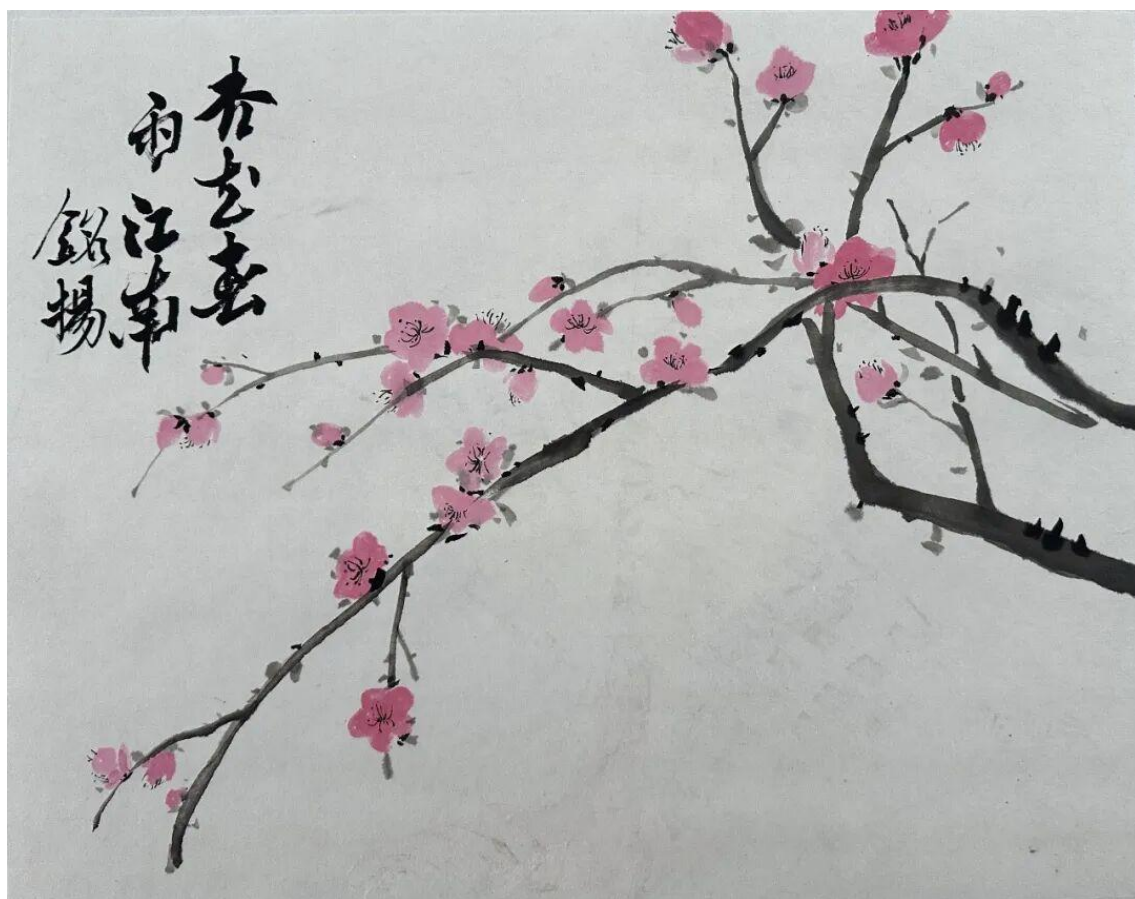
2024 级美术学 2 班程铭扬 临摹