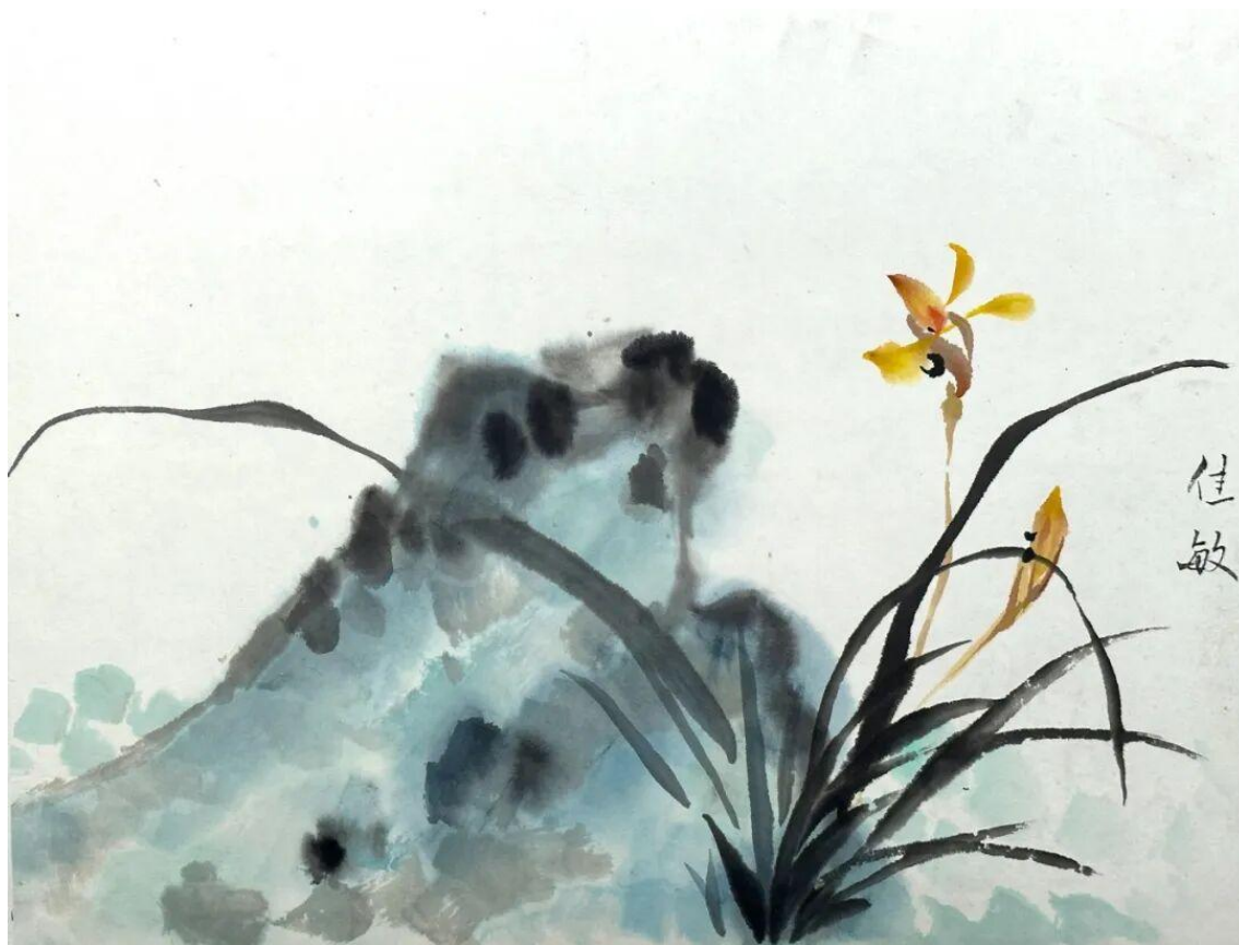
2024 级美术学 2 班张佳敏小品 临摹