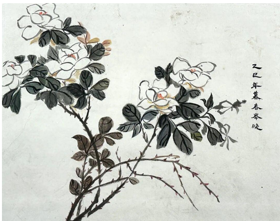
2024 级美术学 2 班龚岑晓 临摹