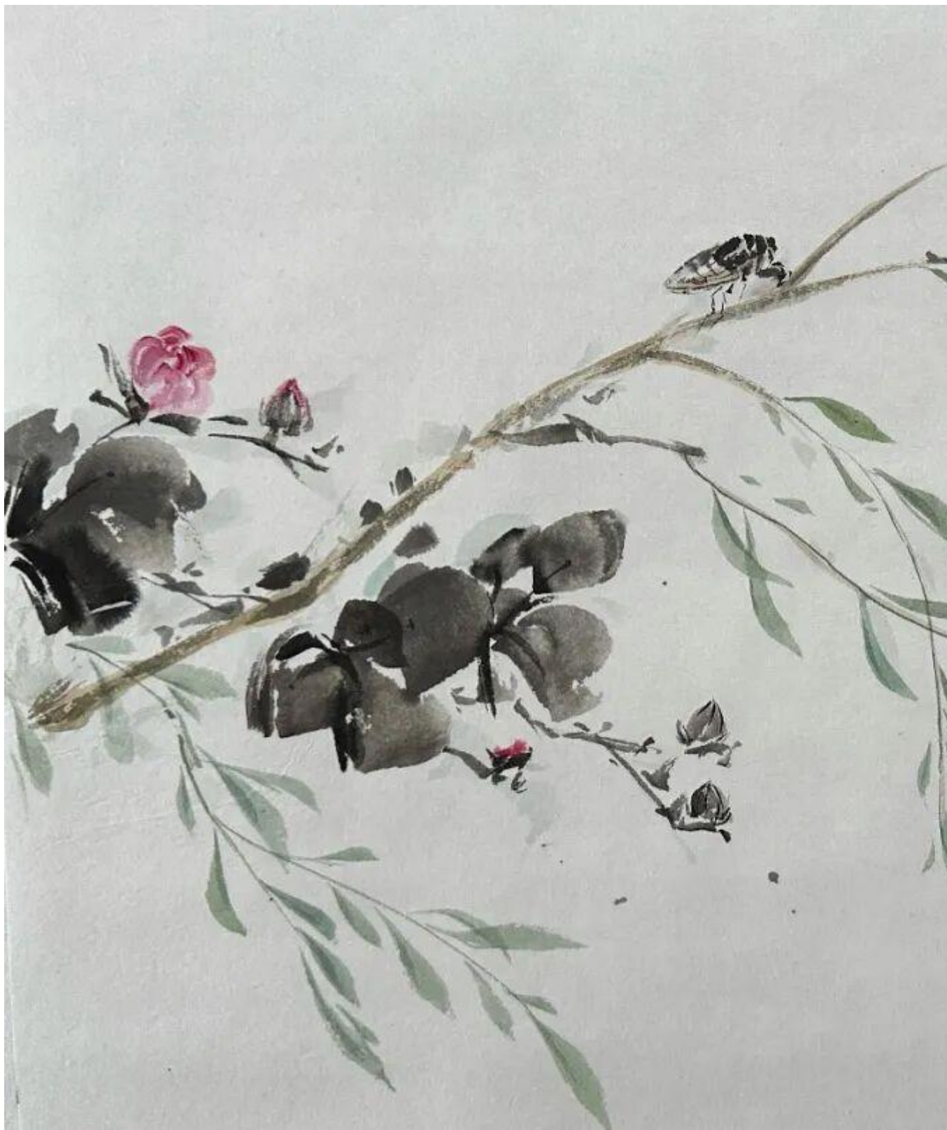
2024 级美术学 2 班郑欣彤 临摹