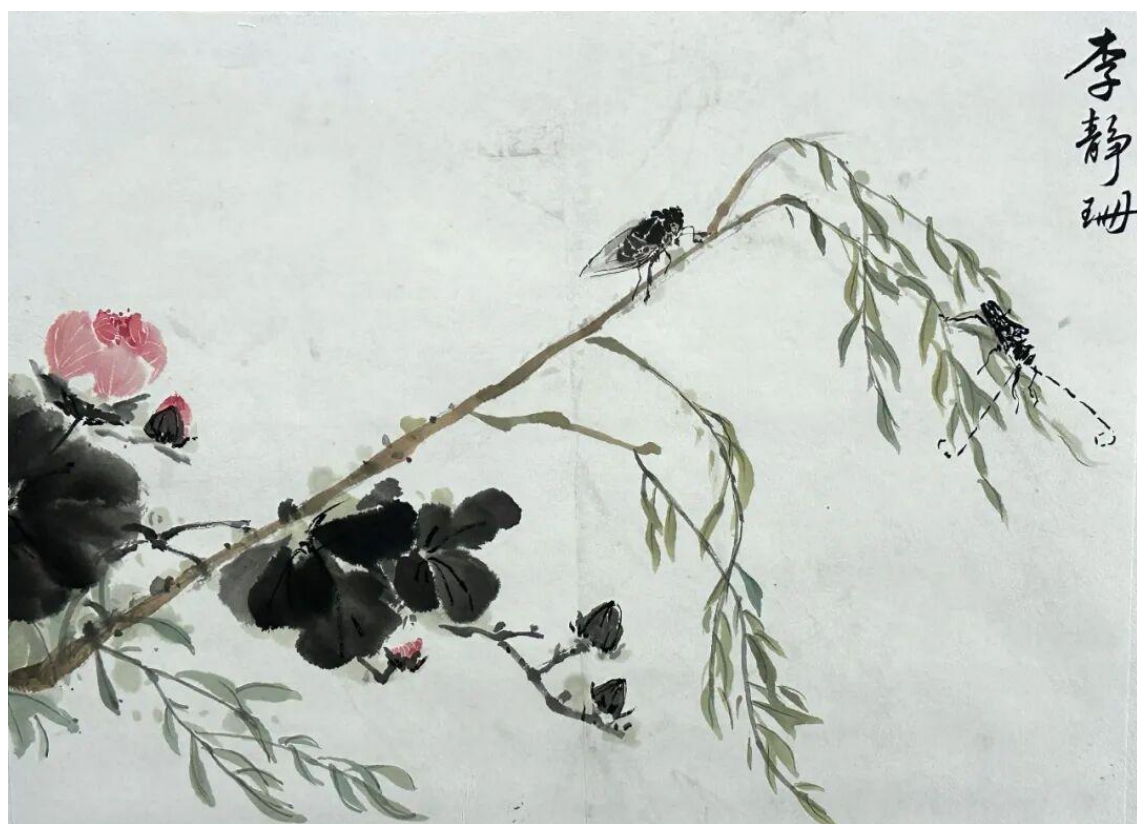
2024 级美术学 2 班李静珊 临摹