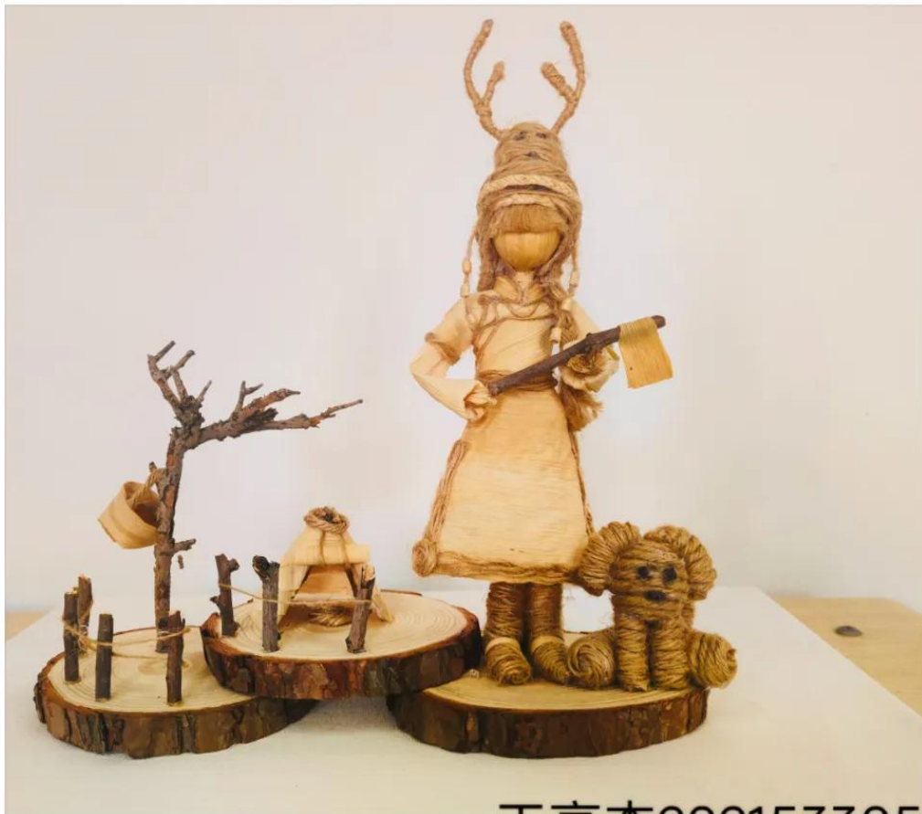
作品名称：《玉米皮材料——鄂伦春女孩》

的蜕变，使学生深入体会言传身教的重要性，进而让美术学专业的学生以此为起点，开创更为实用、多样化的教学技法用在美术课教学中，为大家日后走上中小学美术教师岗位奠定了良好基础。