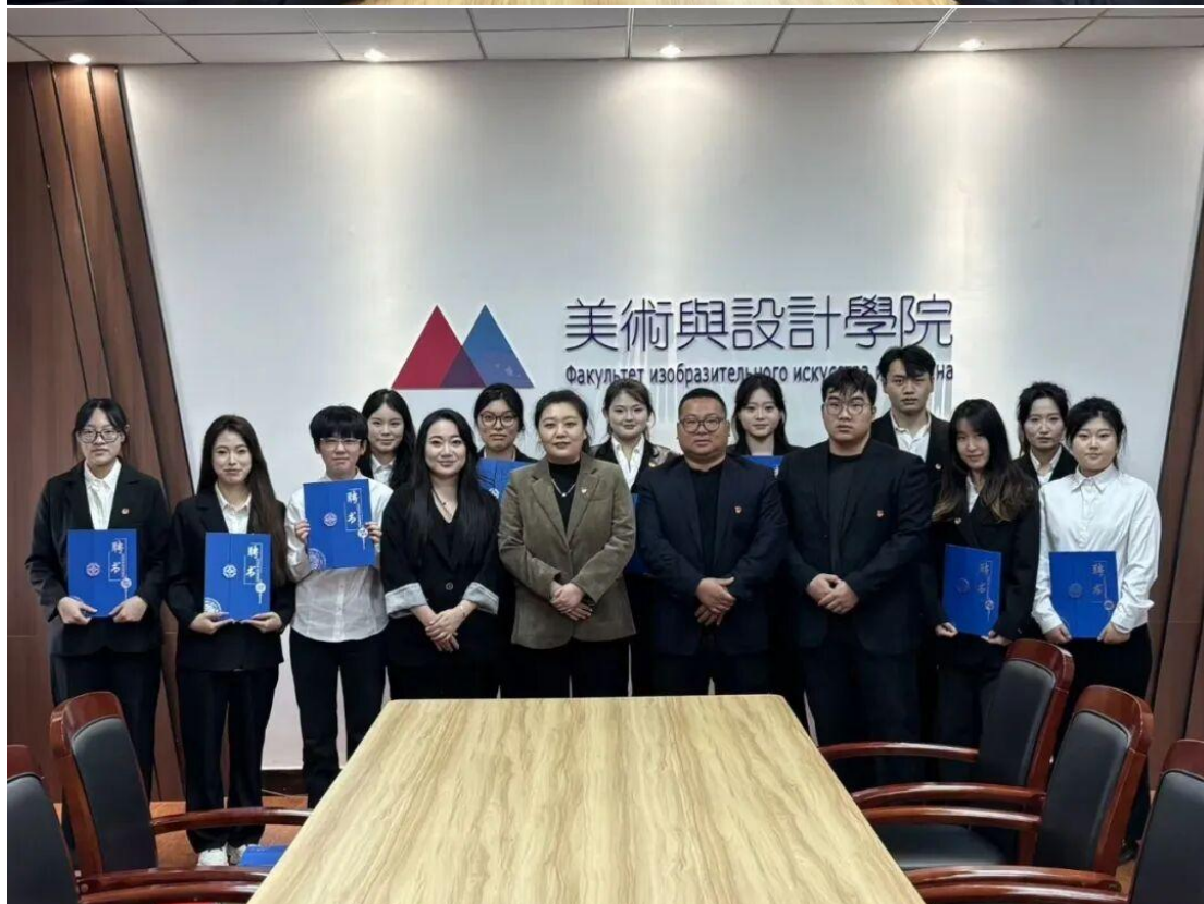
在大会主席团第二次会议上，大会主席团成员审议通过了《黑河学院美术与设计学院第二十七届学生会执行主席选举办法（草案）》《黑河学院美术与设计学院第二十七届学生会主席团选举监票小组名单（草